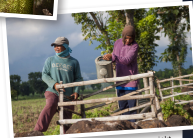
ATPI; Philippinen, Wiederaufforstungsprojekt