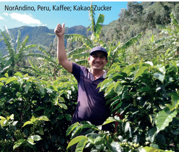
NorAndino, Peru, Kaffee; Kakao; Zucker