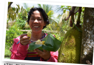
ATPI; Philippinen; Mascobado-Zucker

Wir sind Vorreiterin, Antreiberin und Gestalterin einer Welt, in der unsere Kinder und Enkel*innen im Süden wie im Norden leben möchten: solidarisch und respektvoll miteinander in einer intakten Natur innerhalb der planetaren Grenzen.