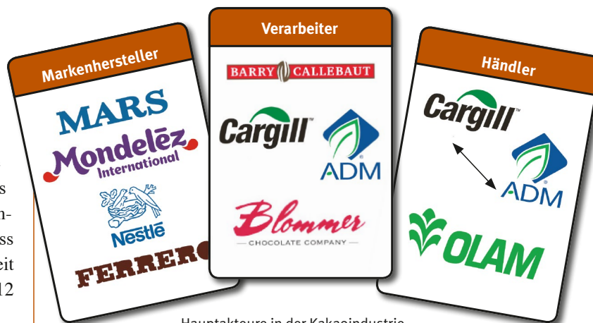
Hauptakteure in der Kakaoindustrie

Abgesehen von einigen Schweizer Konzernen stammen die mächtigsten Einzelhandels- und Nahrungsmittelkonzerne, die Hersteller von Agrarbetriebmitteln und Handelskonzerne aus den G7-Ländern. Um die Verletzungen von Arbeitsrechten von Plantagenarbeiter/innen und unfaire Handelspraktiken gegenüber Kleinbäuerinnen in globalen Produktketten zu verhindern, müssen die „Lead Companies“, also die mächtigen Konzerne in den Ketten, zu fairen Praktiken gegenüber ihren Zulieferern und zu Transparenz und Sorgfalt entlang der gesamten Zulieferkette verpflichtet werden. Hier sind die G7-Regierungen kollektiv gefragt. Auf der Agenda der G7 steht für 2015 das Thema „soziale Standards in Lieferketten“ – höchste Zeit sich gemeinsam auf konkrete Schritte auch für den Agrarsektor festzulegen.