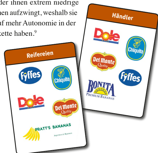
Hauptakteure im Geschäft mit Bananen

Bananen sind das zweitwichtigste Exportgut der dominikanischen Republik und eine wichtige Beschäftigungs-, Gehalts- und Einkommensquelle in ärmeren Regionen des Landes. 6 90 Prozent der Produzenten sind Kleinbäuerinnen und Kleinbauern (mit einer Anbaufläche von 1,2 bis 2,5 ha), sie erwirtschaften ca. 50 Prozent der Bananenproduktion des Landes. 7 Aufgrund der fehlenden Infrastruktur (Lagerung, Kühlung, Exportlogistik) für die empfindlichen und leicht verderblichen Bananen haben Kleinbauern nicht die Möglichkeit, selbst zu exportieren. Deshalb landen Kleinbauern für den Export ihrer Früchte bei privaten Exporteuren, die üblicherweise vertikal integriert arbeiten. Oftmals besitzen die Exporteure große Bananenplantagen, deren Erträge sie zuerst an ihre Kunden verkaufen. Kleinbauernkooperativen fungieren nur als Lieferanten von Pufferbeständen, egal wie hoch die Qualität oder wie wettbewerbsfähig ihr Angebot ist. 8 Ohne direkten Zugang zu Importeuren oder Marktinformationen bleiben Kleinbauernkooperativen oft in Abhängigkeit vom Exporteur, der ihnen extrem niedrige Handelskonditionen aufzwingt, weshalb sie kaum Aussicht auf mehr Autonomie in der Wertschöpfungskette haben. 9