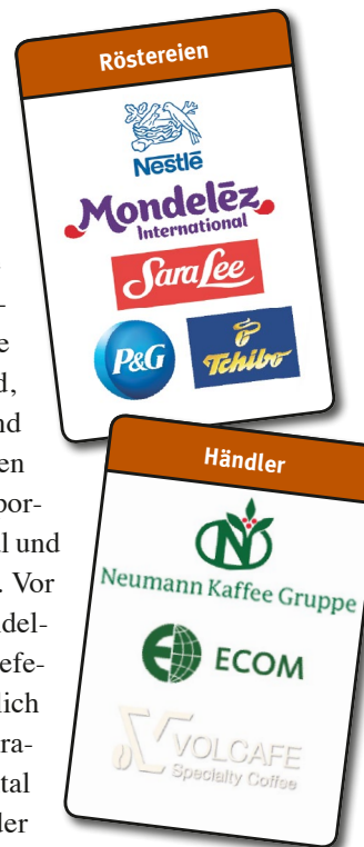
Hauptakteure in der Kaffeeindustrie